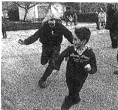
Instantánea del Carnaval rural.