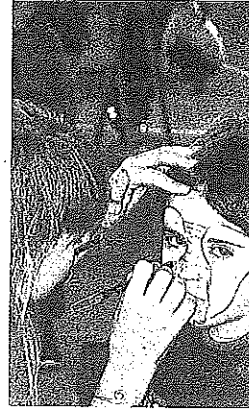
Taller de maquillaje.

De aquí que se haya anunciado con margen de tiempo para que las personas interesadas dispongan de plazo suficiente para preparar y diseñar sus trajes y complementos de cara al certamen. Con todo, el desfile -que partirá a las 19.00 horas desde la Iglesia de Santa Marín para recorrer las calles Elexondo, Crucero, Alara e