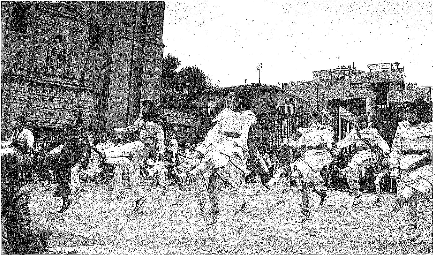
La cita reunió a dantzaris de diez pueblos: Labastida, Samaniego, Villabuena de Álava, Baños de Ebro, Elciego, Laguardia, Lapuebla de Labarca, Yécora, Oion y Lantziego.