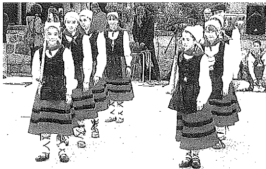
Durante la jornada bailaron dantzaris de todas las edades.

Tras ello, todos los grupos se movilizaron en un gran pasacalles que recorrió buena parte de la trama urbana, deteniéndose en varios lugares para interpretar danzas hasta que dieron las 12.30 horas, cuando los grupos de participantes, veci-