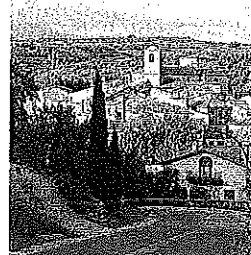
Moreda de Álava.

La necesidad de esa obra se justifica en el propio documento de