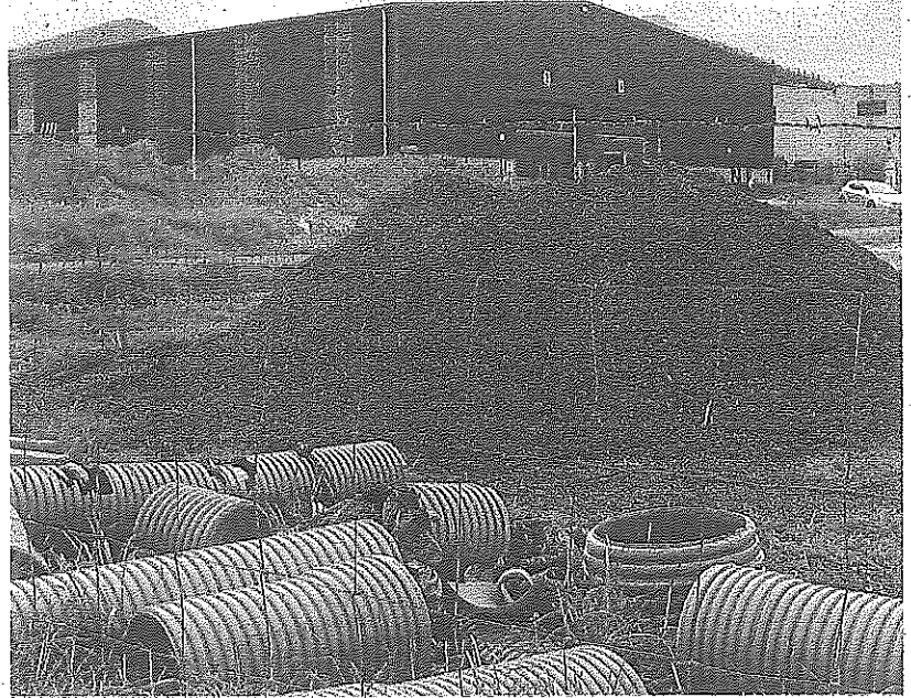
Las tuberías se están colocando ya en los alrededores del polígono de Murga, en Ayala. SANDRA ESPINOSA

Mientras tanto, el sistema de colectores que recorrerá toda la comarca empezó a construirse en agosto y ahora se trabaja en las inmediaciones del polígono industrial de Murga y en el barrio