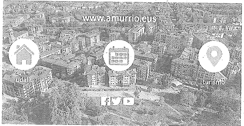
Nueva web del Ayuntamiento de Amurrio.

● Los trámites con el Consistorio ya pueden efectuarse sin necesidad de desplazamientos ● La herramienta 'online' es "más intuitiva, ágil y sencilla"