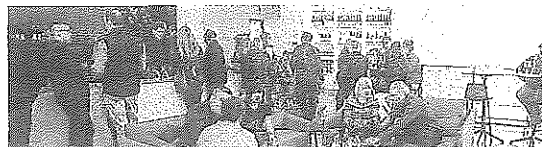
Inauguración de un recinto de Valdemar en EEUU.

Valdemar Family construyó Valdemar States en Walla Walla, una bodega de última generación con una espectacular sala de degustación y restaurante. Es la única bodega no americana construida en la reconocida mundialmente y apasionante región vitivinícola de Washington State.