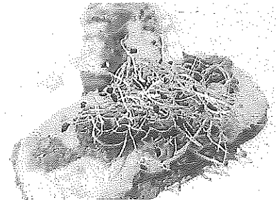
Degustación y pintxos con el aceite como protagonista.