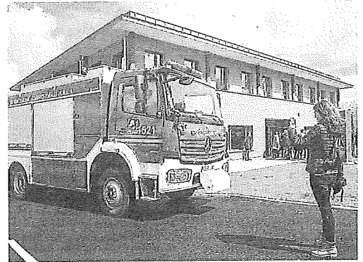
El parque de bomberos de Nanclares de la Oca.

En cuanto a las disposiciones sobre envasado y embotellado detalla que solo podrán expedirse y circular en envases de vidrio de las capacidades autorizadas por la UE; deberá ser realizado exclusivamente en las bodegas inscritas autorizadas por el Consejo Regulador de Viñedos de Álava, situadas en el interior de la zona de producción; podrá emplearse en el etiquetado de vinos amparados por la DOP la referencia a la parcela catastral, polígono o corro siempre que ésta se corresponda íntegramente con la que figure en la declaración de vendimia de la uva con la que sean elaborados y se aprobará un distintivo específico para singularizar en su etiquetado las bodegas que elaboren sus vinos íntegramente a partir de uvas de viñedos propios. ●