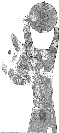
Cartel anunciador 'Protagonista'. A. L.

ABARRO ESORIOXERO MABATX-BILLETAREN 27. FIESTA 27ª FIESTA DE LA VENDIMIA DE RIOJA ALAVESA