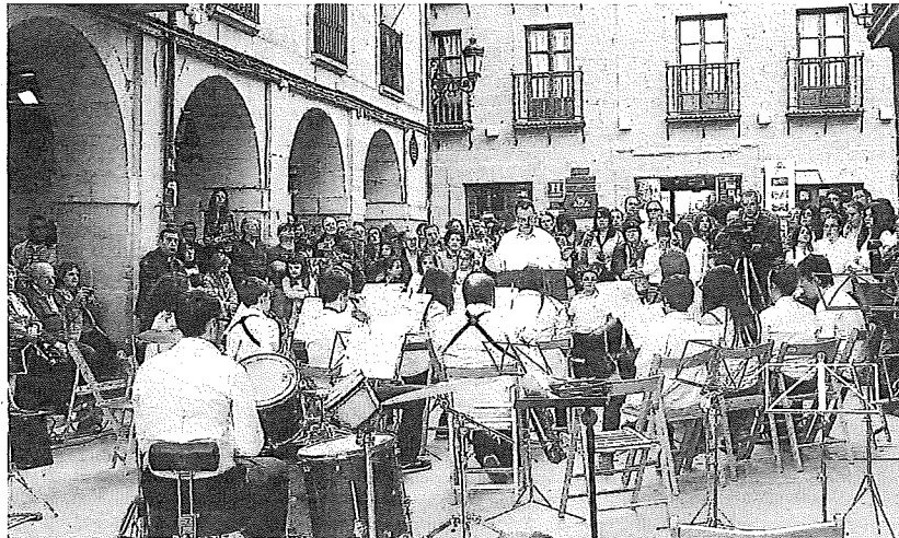
La Agrupación Musical de Laguardia en un concierto.

En esta ocasión, el 9 de julio comenzará la edición correspondiente a este verano de 2022, que se prolongará, durante los sábados y domingos de ese período, hasta el 17 de julio, llevando la música de Rioja Alavesa a los pueblos. En total, según explican desde la organización de la propuesta, nueve actuaciones en otras tantas localidades expondrán, como reza el lema del ciclo, Los colores de la música , ofreciendo una variedad de actuaciones en las que poder disfrutar de la música de las bandas que desarrollan su camino en el territorio.