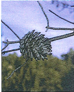
Alepo pinua, herriko bereizgarria. FOTOK

Diputazioak berehala esku hartu zuen, hãrresiaren zati hori finkatzeko eta berreskuratzeko, eta urtearen hasieran amaitu zituzten lan horiek.