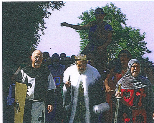
Labrazako Erdi Aroko jaia bost urtean behin egiten dute. LABRAZA.EUS

Harresia eta Mairuaren Iturria Labrazaren kasuan, harresia forua eman eta berehala eraikitzen hasi ziren, eta gaur egun herriko monumenturik garrantzitsuenak dira. Halere, erortzeko arriskuan ere egon da harresi horren zati bat, duela urtebete inguru. Iazko azaroan, Kultur Ondasun Kalifikatuaren babes arkitektonikoa duen eraikinak aurrekaririk gabeko kalteak jasan zituen, eskualdea astindu zuten euriteek eragin zuten lur-jausi baten ondorioz.