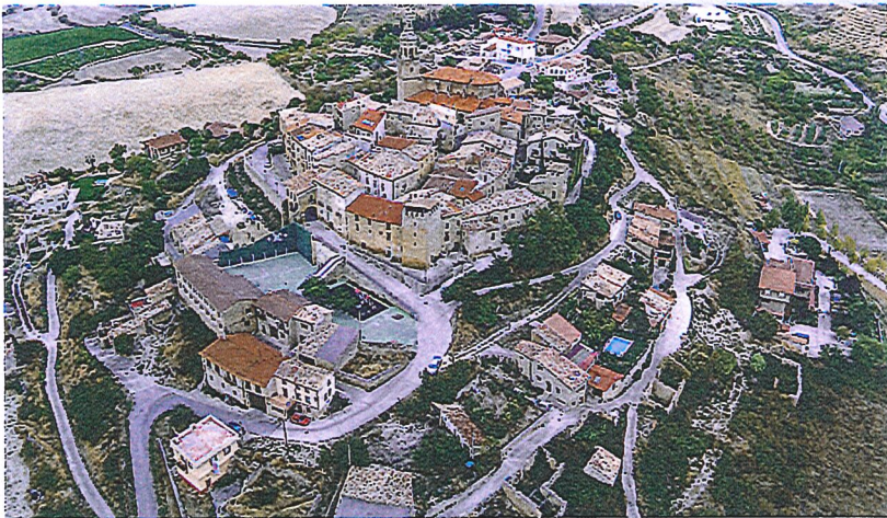
Euskal Autonomia Erkidegoko herri harresitu txikiena da Labraza. LABRAZA.EUS