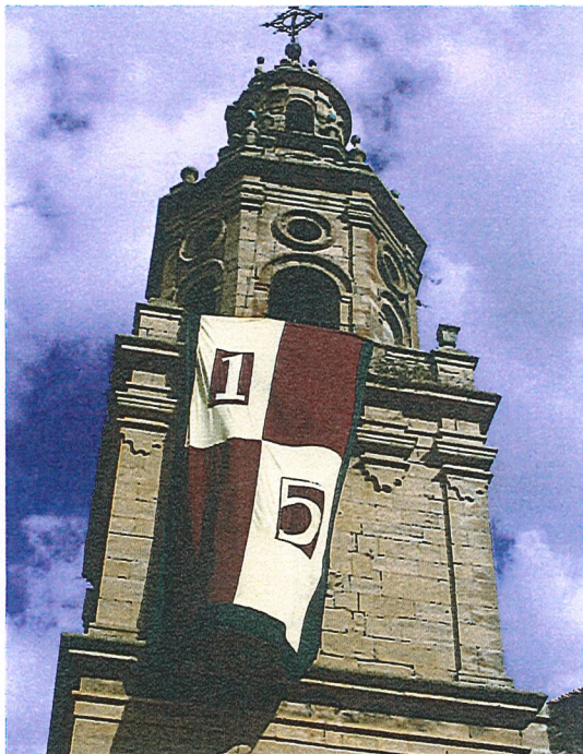
Labrazako kaleak eta eraikinak apainduko dituzte larunbatean. BEGOÑA MTZ. DE OLCOZ

"1996. urtean ospatu zen lehenbiziko aldiz Erdi Aroko jaia, herriko foruak 1196. urtean eman zirelako eta 800 urte betetzen zirelako. Herria dekoratzen dugu, herritarrek ere Erdi Aroko jantziekin mozorratzen gara, eta inguruko artisauak eta ekoizleak etortzen dira". Aurten, uztailearen 9an ospatuko dute jaia; umeentzako ipuin kontalaria izango dute, eta El Moroko iturrian antzerkia egingo dute. "Herri bazkariarekin Alepo elkartearentzat dirua biltzen da,