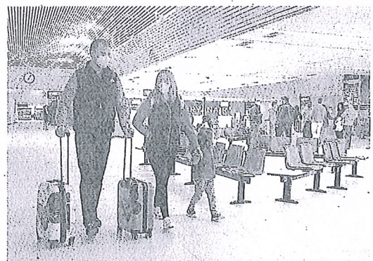
Unos viajeros se mueven con sus maletas por Foronda. R. G.

Las carreteras alavesas, punto de paso además para quienes se dirigen desde Francia hacia el sur de España o al paso del Estrecho, notarán asimismo un incremento del tráfico en esta 'operación salida' de verano. También se percibirá en sentido contrario, hacia Bizkaia, por ejemplo hacia el aeropuerto de Loiu ya que muchos alaveses emprenderán desde allí sus vacaciones. En ese aeródromo se asoman unas jornadas muy intensas, con 523 vuelos en este mismo periodo frente a los 414 que por estas fechas registró el año pasado. Habrá conexiones con Atenas, Oslo, Eindhoven... y hasta ocho vuelos, hoy, con Menorca.