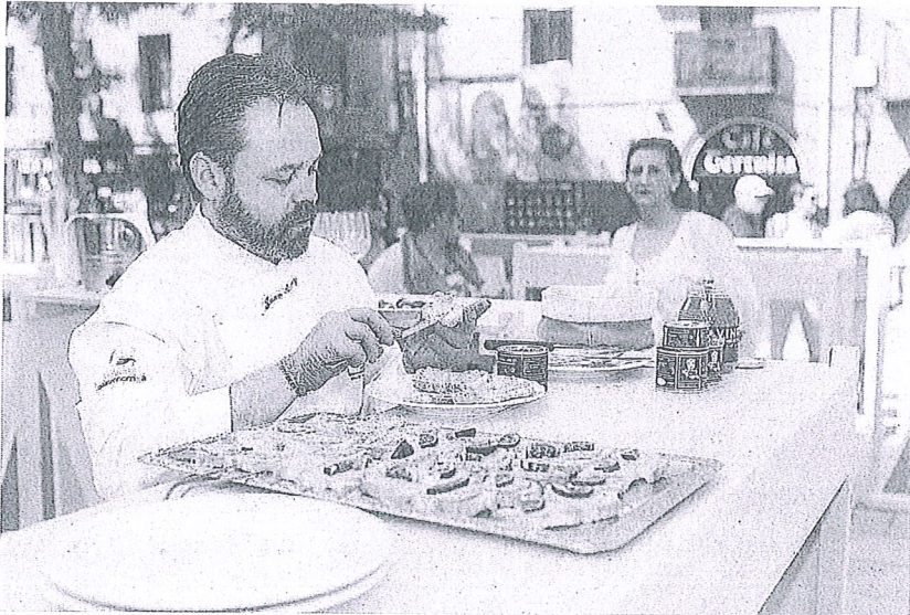
Oion vivió ayer una jornada de gran ambiente con 'En torno a la mesa'.