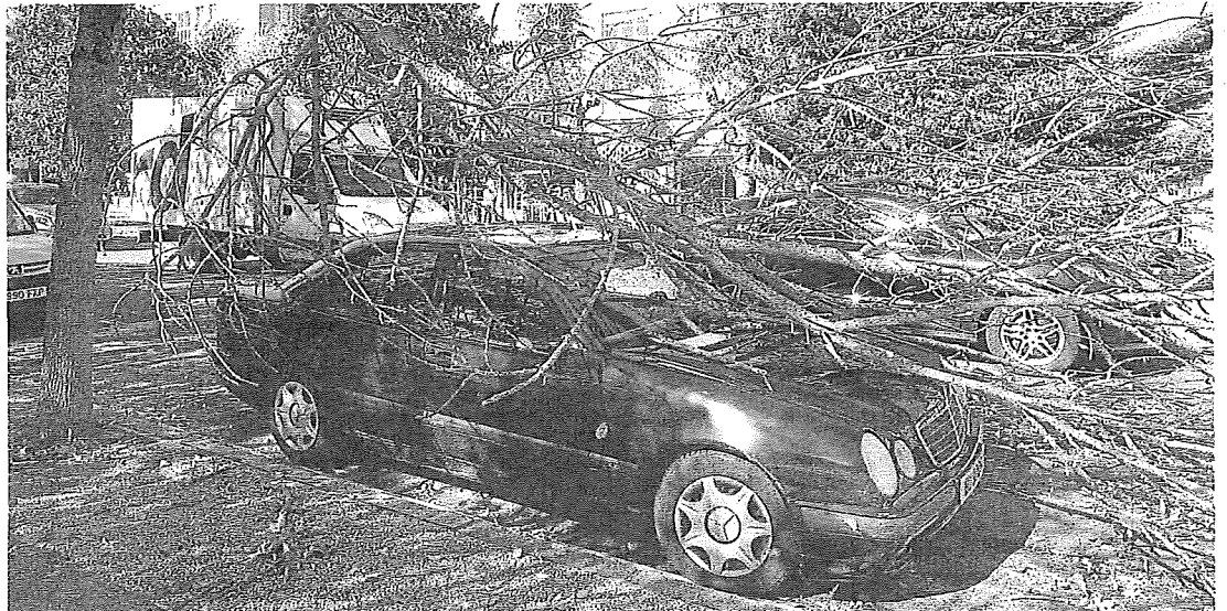
Una rama desprendida sobre un vehículo estacionado en la calle Portal de Castilla. BLANCA CASTILLO

También sufrieron desperfectos varios automóviles estacionados en la vía pública. Al menos tres de ellos sufrieron daños tras caerles encima troncos desmembrados por la fuerza del vendaval. Muchos más fueron golpeados por conte-