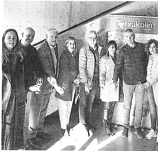
Presentación de la iniciativa.

Cuadrilla de Ayala son los encargados de organizar, de nuevo, Txakoli Bizi que ya obtuvo gran éxito la pasada edición. Además, cuenta con la subvención de la Diputación Foral de Álava y del Gobierno Vasco.