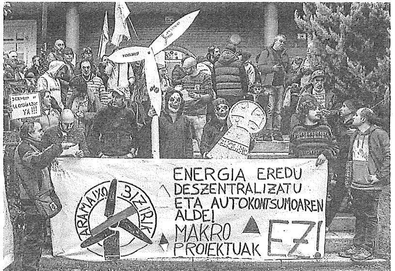
Vecinos del municipio alavés convocaron un acto de protesta contra el proyecto eólico. JESÚS ANDRADE

Al contrario que ha ocurrido con otros proyectos de parques eólicos en la provincia como el de Labraza o el de Azáceta, la coalición abertzale ha mostrado una posición diferente ante el plan de la noruega Statkraft para Aramaio, al que ha llegado a definir como