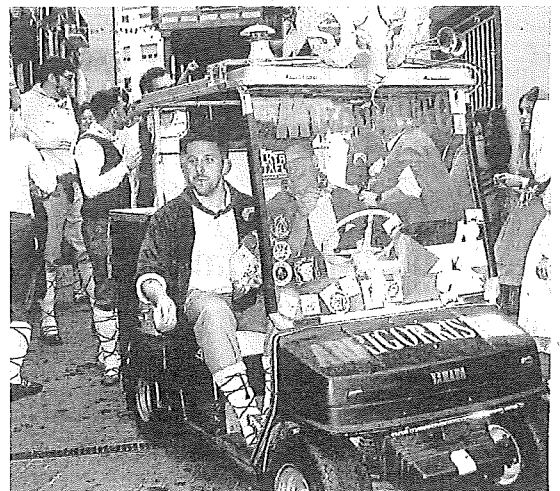
Cuadrillas de blusas en el txupinazo de 2025.

En las próximas semanas el ayuntamiento hará un llamamiento a la población para que proponga a la persona o grupo que lanzará el txupinazo el próximo 3 de octubre. El acontecimiento central volverá a ser la feria ganadera, que cumplirá su 631 edición. - Eva San Pedro