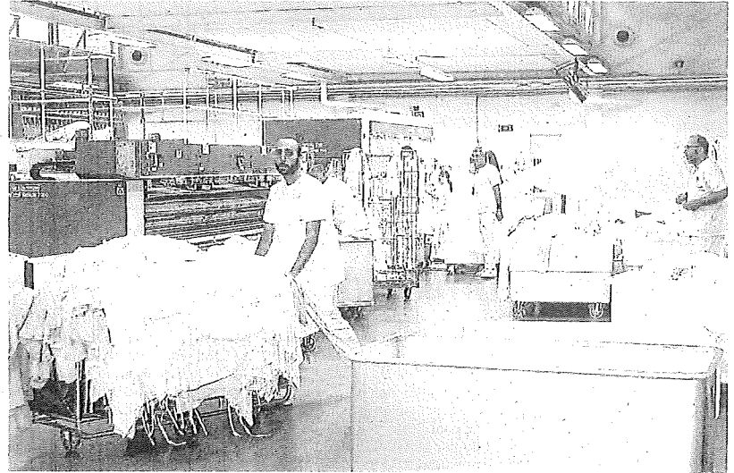
Trabajo en la lavandería de Indesa.

Indesa es una sociedad sin ánimo de lucro, participada mayoritariamente por la Diputación Foral de Álava, y cuenta también con la participación de otras administraciones públicas del territorio, además del Gobierno Vasco. Con una plantilla que supera el millar de personas