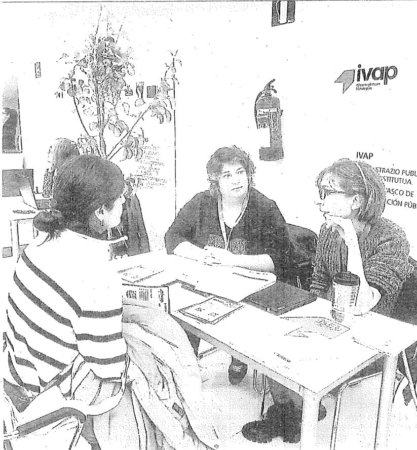
La feria EmpleoGune contó con stands informativos, talleres, charlas y un escape room didáctico.