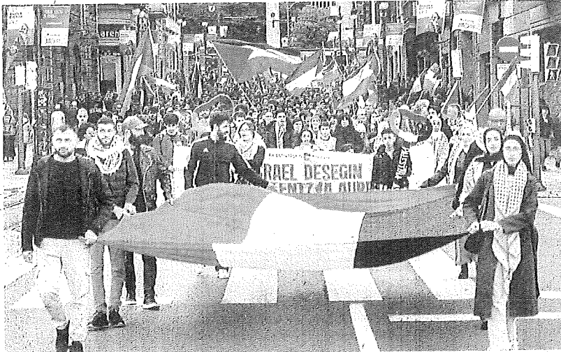
Palestinarekin Elkartasuna taldeak antolatutako mobilizazioa, atzo, Bilbon.