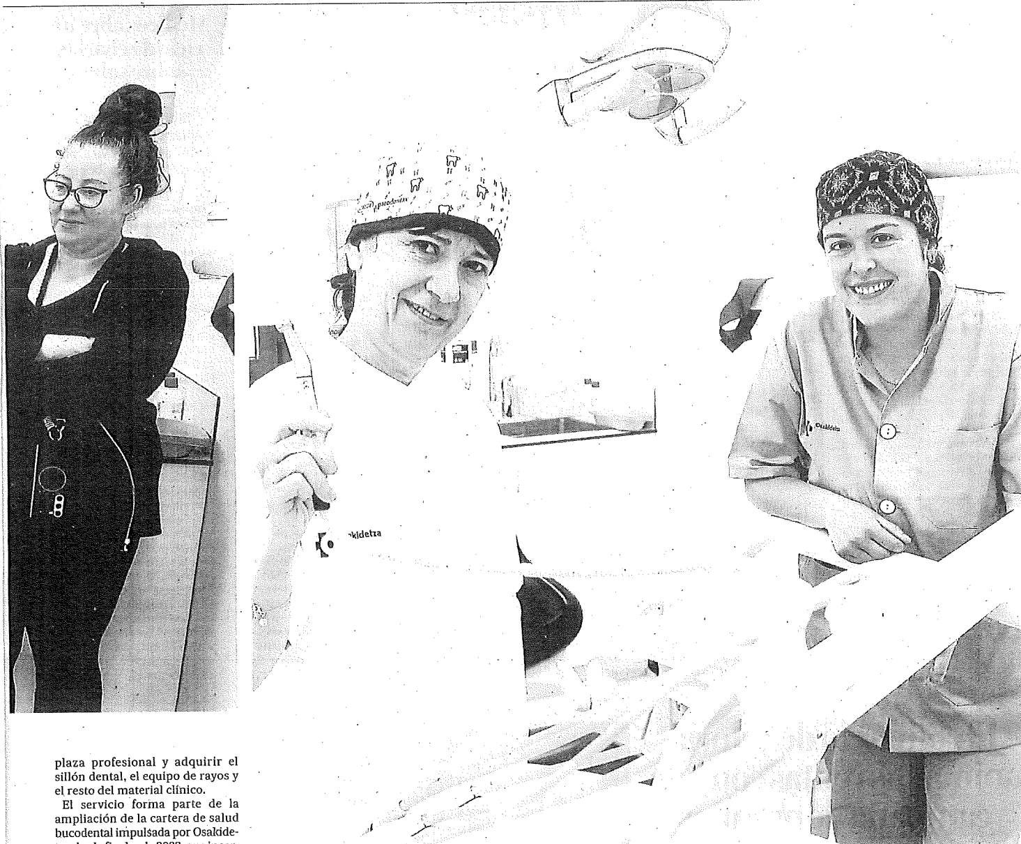
El equipo de dentista e higienista en la nueva consulta del centro de salud de Oion.

plaza profesional y adquirir el sillón dental, el equipo de rayos y el resto del material clínico.