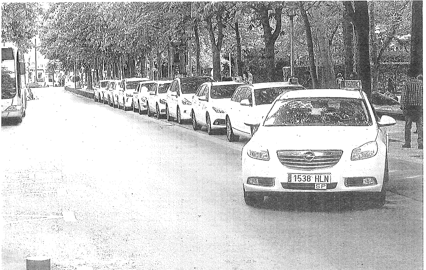
Parada de taxis en Cadena y Eleta, frente a la Catedral Nueva.