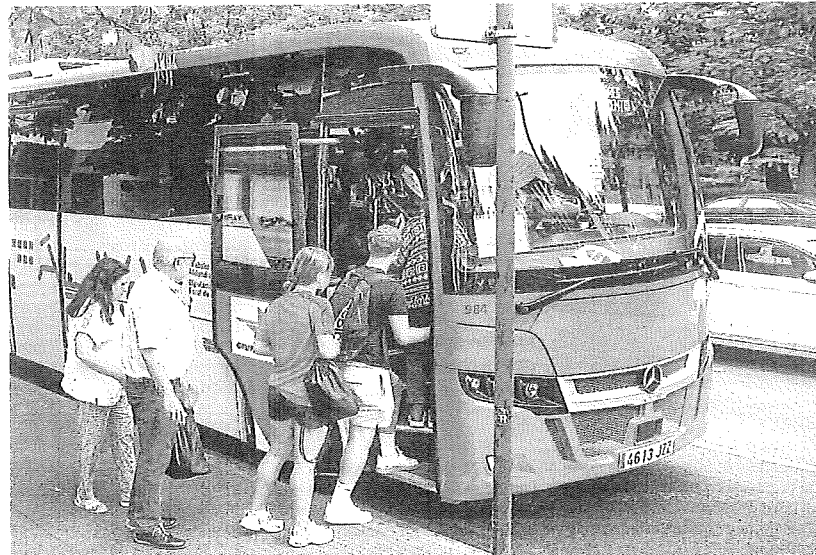
Viajeros se sube a un vehículo de Alavabus en la Avenida de Gasteiz.

Además, se dispondrá de diez intercambiadores. Ocho estarán localizados fuera de Vitoria, que servirán para conectar Alavabus con el transporte comarcal en municipios cabecera como Llodio, Amurrio, Murgia, Legutio, Alegría-Dulantzi, Agurain-Salvatierra, Oion y Laguardia. Los otros dos se encontrarán en la propia capital. Uno en