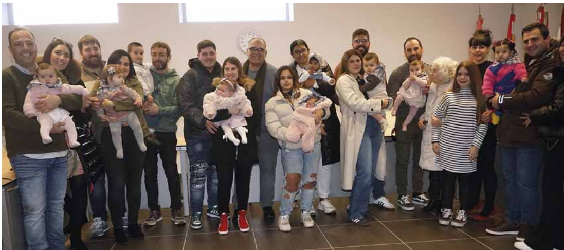
ZAPI BANAKETA 2024ko urtarrilaren letik, abenduaren 31ra Bitartean jaiotako umeei. REPARTO DE PAÑUELOS a los nacidos del 1 de enero al 31 de diciembre de 2024.